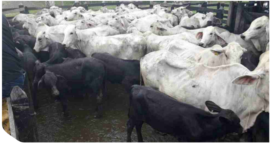
Angus x Brahman producto de Inseminación Artificial a Tiempo Fijo

El programa IATF permite trabajar con vacas a partir de 45 días post parto, logrando cumplir con el objetivo de tener un periodo de servicio hasta los 85 días y así lograr un ternero/vaca/año. Adicionalmente, con la IATF el peso de los terneros al destete, al año y al sacrificio se incrementa debido al progreso genético logrado por la utilización de toros de genética superior (toros probados) comparados con los usados normalmente por monta natural.